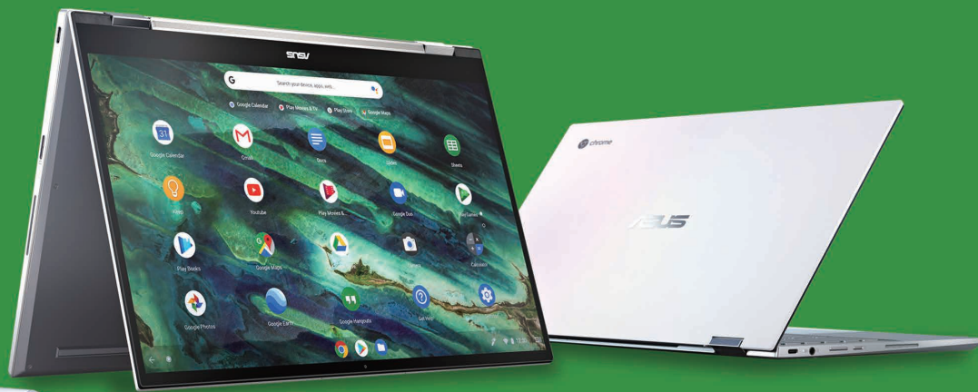
※写真は ASUS Chromebook Flip C436FA

Chromebook はセットアップ不要です。Google アカウントにログインするだけで、数秒で起動します。また、長時間駆動バッテリーを搭載しており、外出時に充電器を持ち歩く必要がありません。ウイルス対策機能や音声検索などの機能は自動アップデートで常に最新です。データは、Android 搭載のスマートフォンやタブレットのデバイスでの作業データと常に同期されます。デバイスにかかわらず、いつでも必要なデータにアクセスできます。共有も、アカウントを切り替えるだけで、自分のデータが他のユーザーに操作されることはありません。Google サービスを搭載しているため、Gmail、マッシュドキュメント、写真など、すべてのデータをクラウドに安全に保管できます。万が一ノートパソコンにコーヒーをこぼしても、データがなくなることはありません。