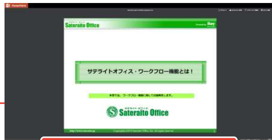
マイクロソフトオフィスビューアー