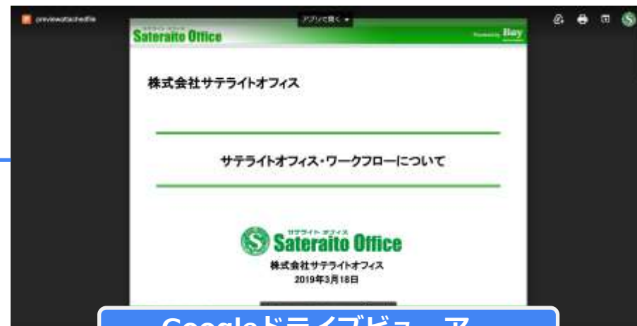
Googleドライブビューアー